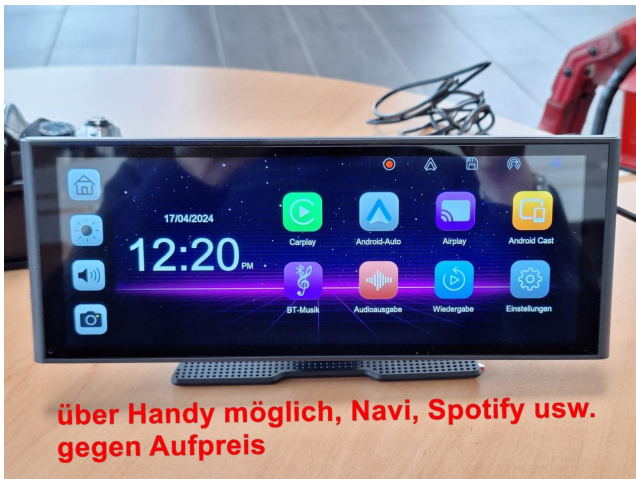
über Handy möglich, Navi, Spotify usw. gegen Aufpreis